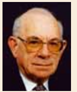
ד"ר אליהו וינוגרד

מדי בוקר היו מניחים על שולחנו של הנשיא קבוצה גדולה של מכתבים. חלק ניכר מהם בא ממקורות מקובלים: מבית המשפט העליון, מהנהלת בתי המשפט או משופטים, מלשכת עורכי-הדין, או מגורמים אחרים שהיו קשורים לעבודה בבית המשפט. מיעוטם: כשלושה או ארבעה מכתבים מדי יום, היו מכתבים של אזרחים מן השורה. היו שפנו בבקשה מסוימת: כגון בקשה להקדמת דיון בתיק מסוים, והיו שפנו בלי כל תכלית נראית